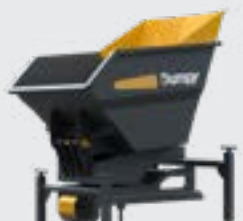
BENNE TP 380L PIVOTANTE 90°