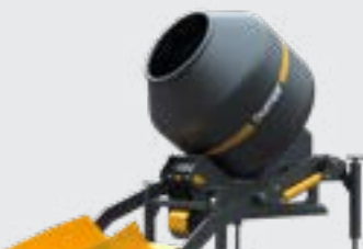
BÉTONNIÈRE 355L AUTOCHARGEUSE