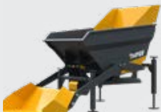
BENNE TP 380L AUTOCHARGEUSE