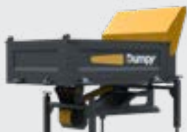
PLATEAU À RIDELLES 350 L