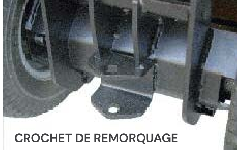
CROCHET DE REMORQUAGE