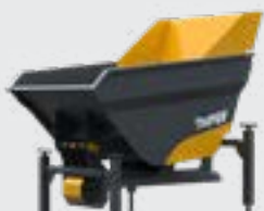
BENNE TP 380L