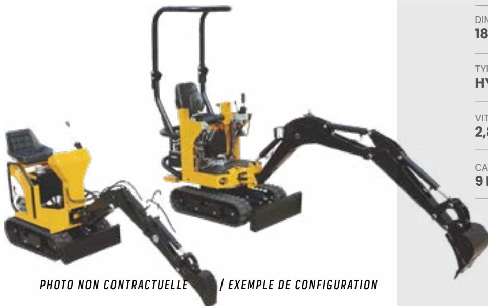
PHOTO NON CONTRACTUELLE / EXEMPLE DE CONFIGURATION

Les mini-pelles DUMPY E100 et E150 combinent puissance et agilité dans un design compact. L'E100 excelle dans les espaces étroits, tandis que l'E150 offre une capacité supérieure pour les travaux plus lourds. Robustes et faciles à entretenir, ces modèles sont parfaits pour des performances fiables et efficaces.