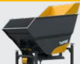
BENNE GRANDE CAPACITÉ 600L