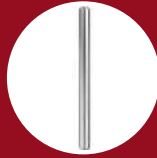
Ref. 19117 TCP Rallonge ø16