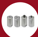
Ref. 60501 Rallonge piston M6-M8