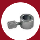
Ref. 19103 Frein de tige