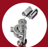
Ref. 19111-12-13-14 Accessoire pour tube