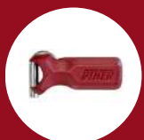
Ref. 59001 Poignée multiposition