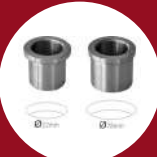
Ref. 19169-19170 TO - Douille d'adaptation