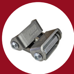
Adaptateur pour tube