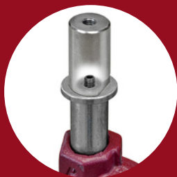
Rallonge piston M6 et M8